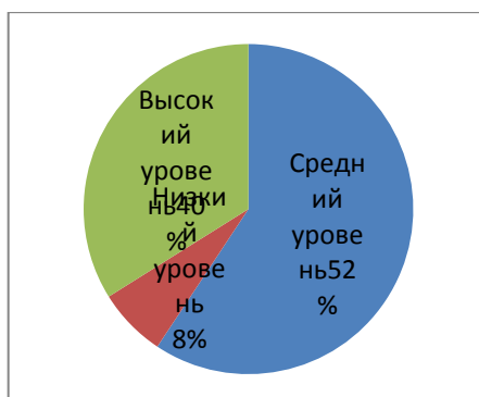
Рисунок 2. Оценка сформированности финансовой грамотности у детей подготовительных групп на конец учебного года.